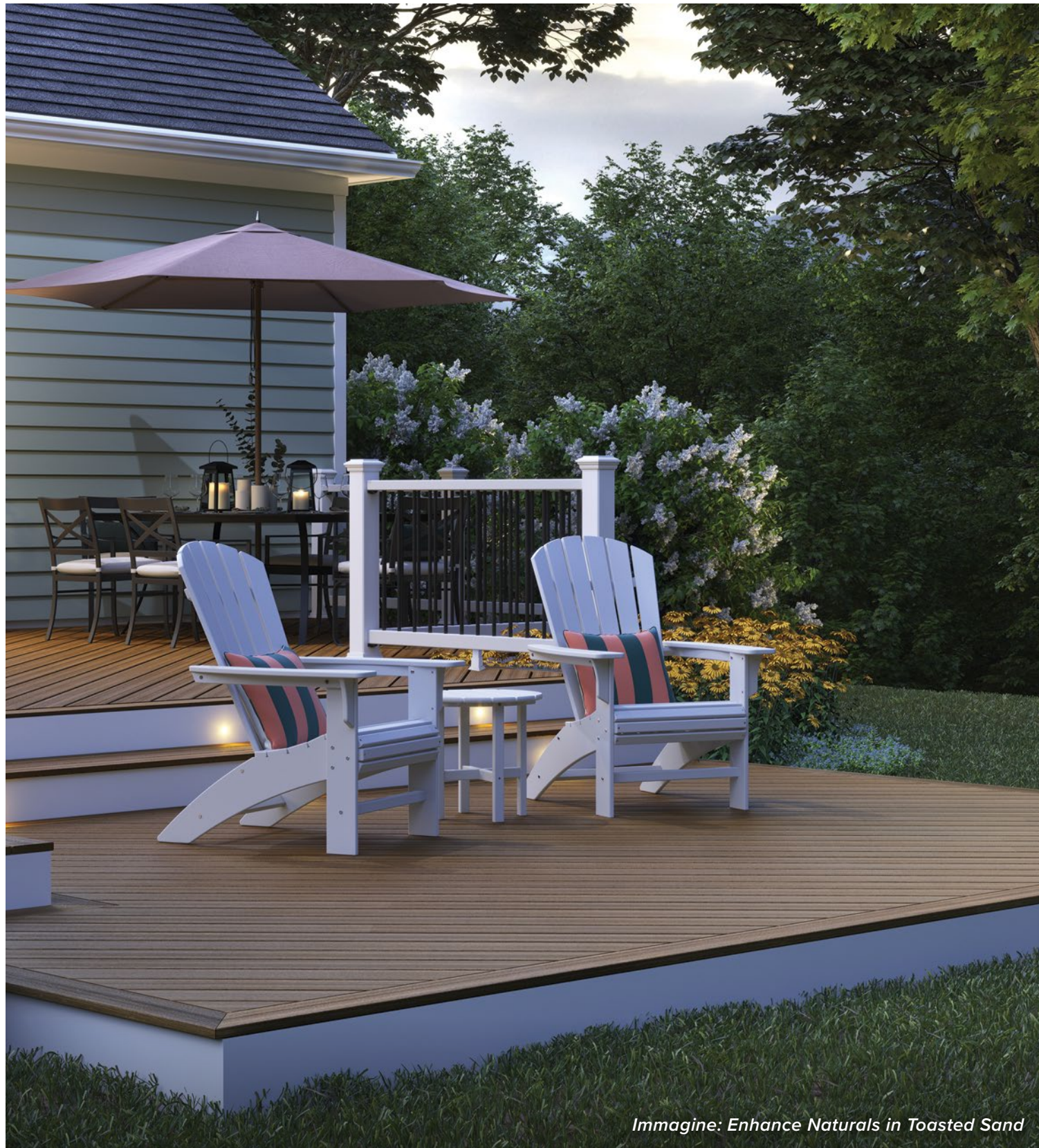
Immagine: Enhance Naturals in Toasted Sand