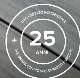
Immagine: Enhance Naturals in Foggy Wharf